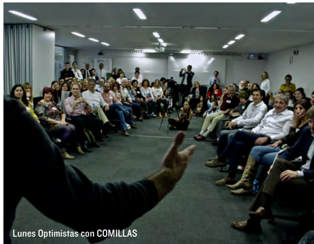
Lunes Optimistas con COMILLAS