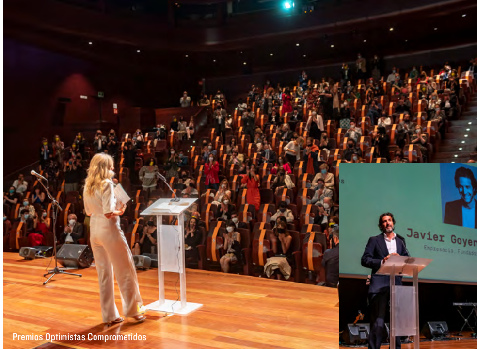
Premios Optimistas Comprometidos